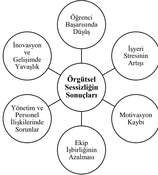
Şekil 2: Örgütsel Sessizliğin Sonuçları

Araştırmanın ikinci alt problemi kapsamında sınıf öğretmenlerinin örgütsel sessizliğin sonuçlarına ilişkin görüşleri incelenmiştir. Öğretmenlerin görüşlerinden hareketle öne çıkan sonuçlar şekil 2’de gösterilmektedir.